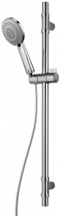
ASTA SALISCENDI PER DOCCIA BOSSINI