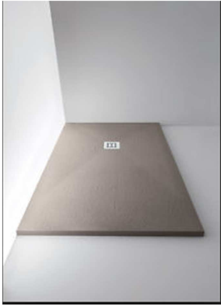
PIATTO DOCCIA IN RESINA